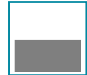
1/2 Seite quer 180 mm x 88 mm