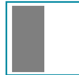
1/2 Seite hoch 88 mm x 180 mm