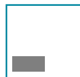
1/8 Seite hoch 88 mm x 42 mm