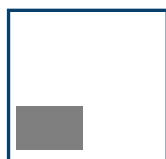
1/6 Seite hoch 88 mm x 57 mm