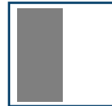
1/2 Seite hoch 88 mm x 180 mm