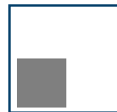
1/4 Seite hoch 88 mm x 88 mm