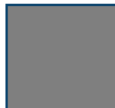
1/1 Seite 210 mm x 200 mm + 3 mm Beschnitt