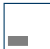
1/8 Seite hoch 88 mm x 42 mm