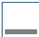
1/6 Seite quer 180 mm x 27 mm